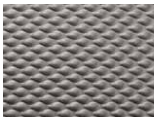
NOVA STRUCTURE Amsterdam