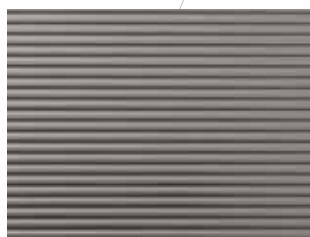
NOVA STRUCTURE New York