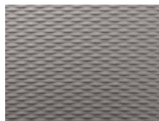
NOVA STRUCTURE Paris